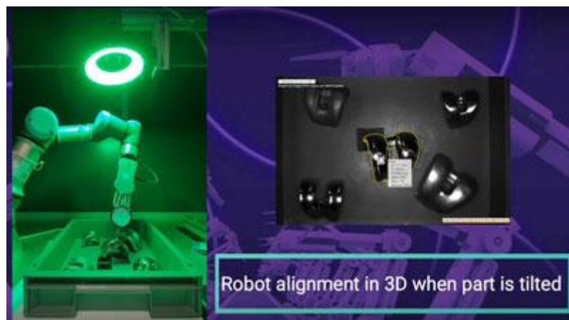
图 3 机器人会在零件倾斜时进行 3D 对齐

实施过程中的困难在于不同表面差异巨大，从哑光到高反光均有，同时形状也非常复杂。零件必须以六自由度 (DoF) 加工，精准度需达到 \pm 3 mm。此外，还要加上工艺环境带来的挑战：零件被容器壁遮挡，排列杂乱，并且必须在不同尺寸的容器中进行抓取和存放。此外，周期时间要少于 15 秒。最后，客户需要确保同一套系统能够在所有抛光阶段实施。最后，拾取和放置机器人应当能够对半结构化配置的零件进行操作和协作。